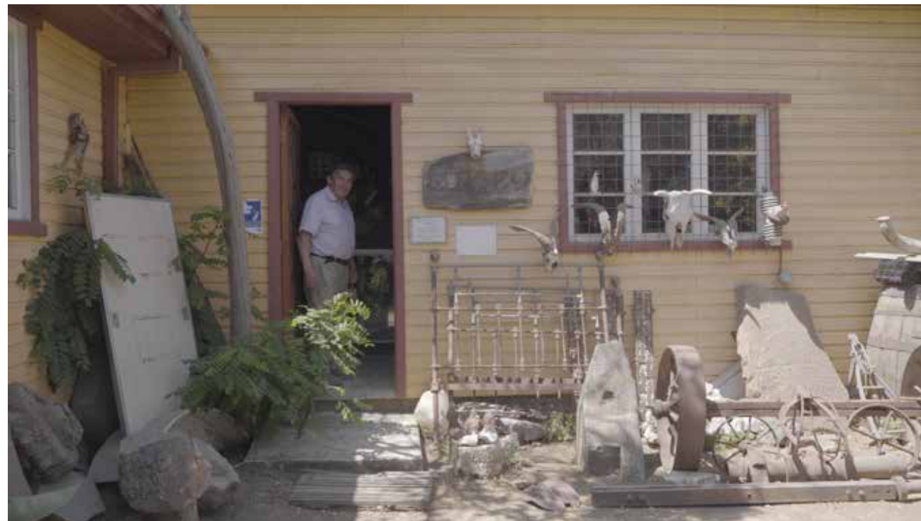
El museo de Aldonis. Fotograma de video.