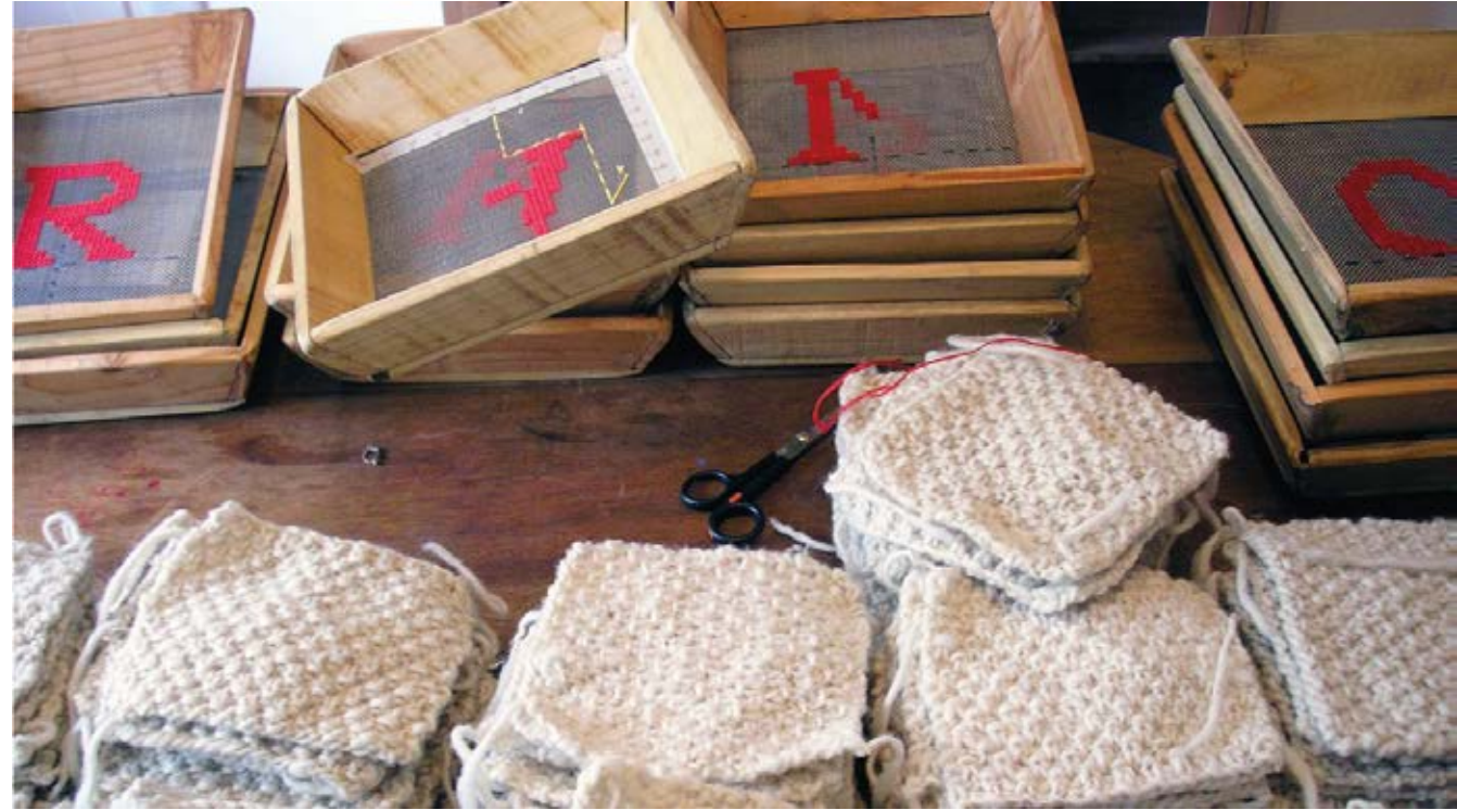
Ficción de un Origen (2006), Dos autorretratos tejidos en lana de oveja cardada e hilada a mano y teñida en escala de grises. Texto bordado a punto cruz en cernidores de malla de acero y madera. Izq. detalle de la instalación. Der. detalle del proceso.

El fragmento de un poema de Paul Celan bordado en punto cruz sobre cernidores de acero y madera conecta dos autorretratos de la artista en la obra Ficción de un Origen , del año 2006, trasladándonos al momento exacto en que Nury adquiere la nacionalidad española. Aquí, es el mismo cuerpo de la artista el que problematiza respecto al desarraigo y al